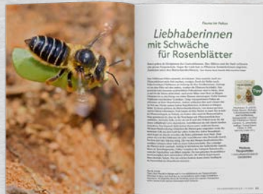
Fauna im Fokus Nah dran an heimischen Gartentieren