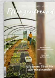
2/22 Samen und Saatgut