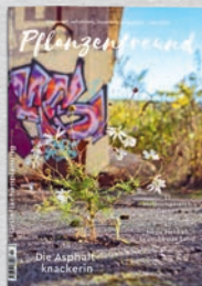
10/22 Grün- flächenplanung