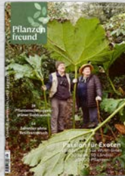
9/23 Sammeln und Jagen