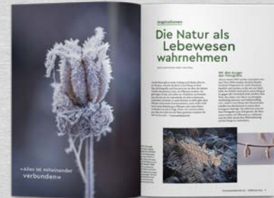
Saisonale Inspirationen Tipps und Informationen zu Gartengestaltung, Fauna und Flora