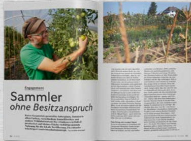
Engagement Ehrenamtliche Projekte sowie grüne Start-ups und Innovationen