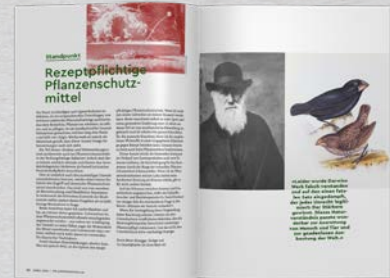
Standpunkt Differenzierte, auch kontroverse Meinungen aus der Gartenwelt