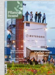
4/23 Artenreich Stadt