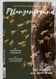
5/22 Bienen & Co.