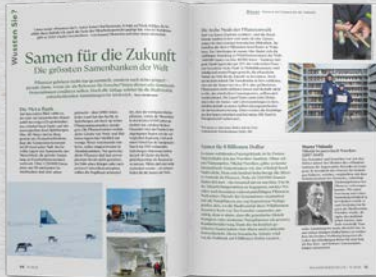
Wussten Sie? Passend zum Schwerpunkt: Wissenshäppchen zum Weiterlesen