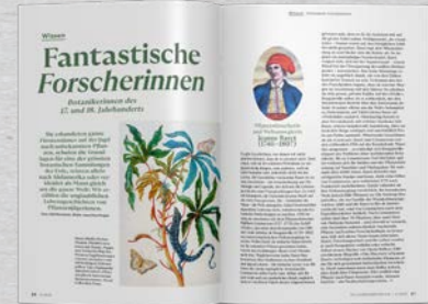
Wissen Fundiertes Fachwissen und Hintergründe