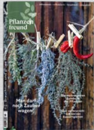
10-11/23 Brauch- tum/grüne Rituale