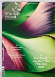
3/23 Pflanzen- nährstoffe