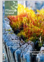
6/23 Algen, Flechten, Moose