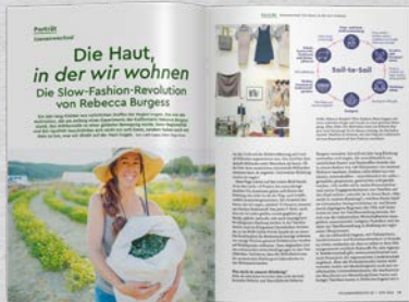
Persönlich Porträts engagierter und charismatischer Gartenmenschen