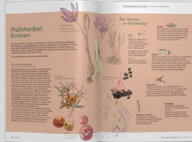
Phänologischer Gartenkalender Zeigerpflanzen, Anleitungen und Tipps für den naturnahen Garten

Platzieren Sie Ihre Werbebotschaft in diesem facettenreichen Themen-Mix!