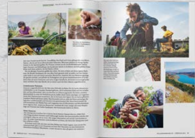
Reportagen/Unterwegs Ein Blick über den Gartenhag, national und international